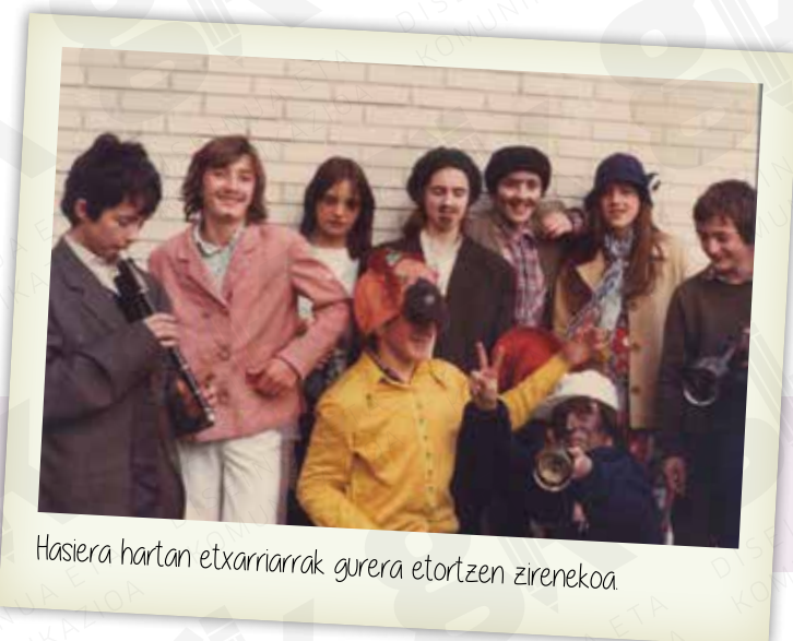
Hasiera hartan etxarriarrak gurera etortzen zirenekoa

En sus inicios, la Ikastola contaba con unos 40 alumnos llegando hoy a ser